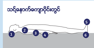
သင့်ခန္ဓာကိုယ်ရှေ့ပိုင်းတွင်